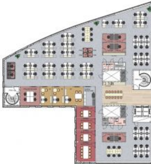
5. krs 718,5m 2