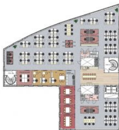
5. krs 718,5m 2