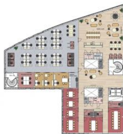
6. krs 718,5m 2