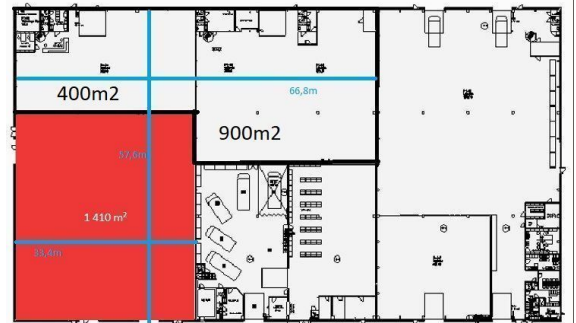
Koskelontie 21-25 – A-talo 1 kerros