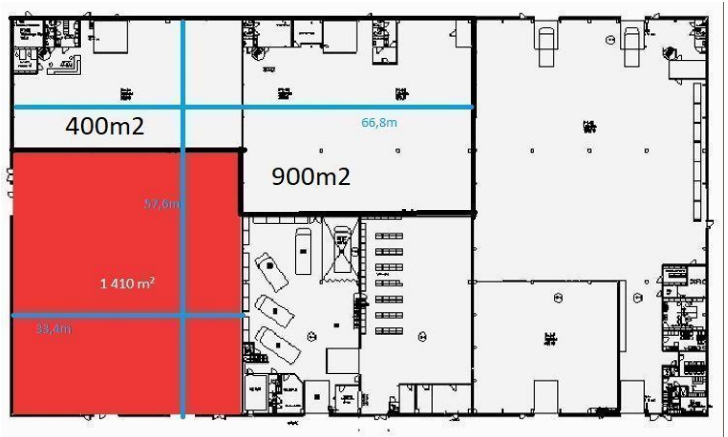
Koskelontie 21-25 – A-talo 1 kerros