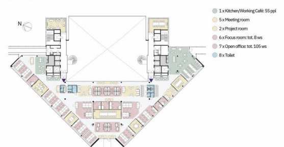
ARC, 7th floor (1270 m 2 ) Keilalahdentie 2-4, 02150 Espoo IDEAL FOR 80-100 PEOPLE