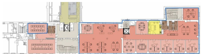
Pinta-ala 445 m 2 43 työpistettä