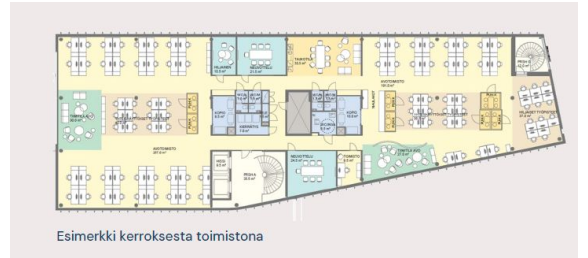
Esimerkki kerroksesta toimistona