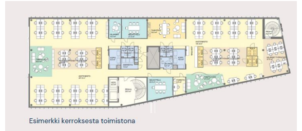
Esimerkki kerroksesta toimistona