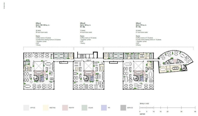
TAPIOLA / Floor +3