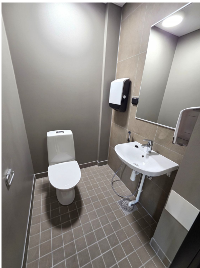
Ruutanakorventie 1, Pirkkala 640,5 m 2