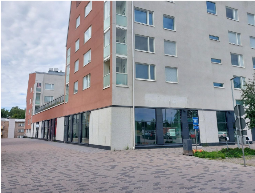
KANNELMÄEN LIIKEKESKUS LIIKETILA I.