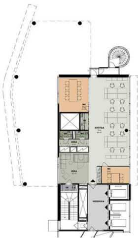
2. KRS 1:150