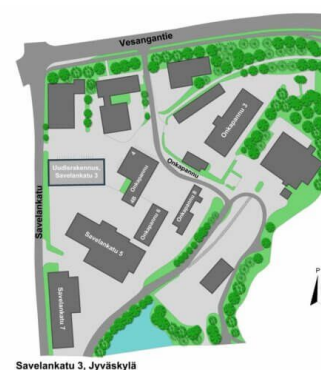
Savelankatu 3, Jyväskylä