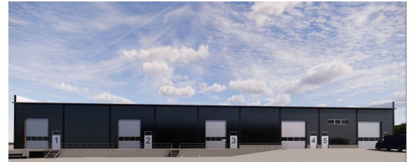
ARKoot Luolala 1 / B-halli