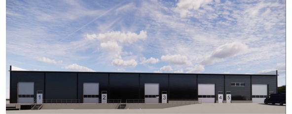
ARKoot Luolala 1 / B-halli