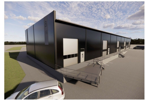
ARKoot Luolala 1 / B-halli