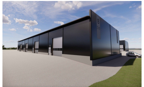
H02 havainne 2