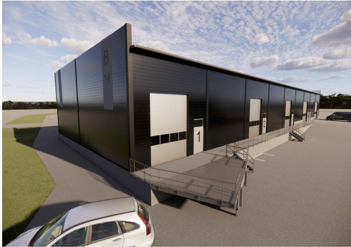
ARKdot Luolala 1 / B-halli