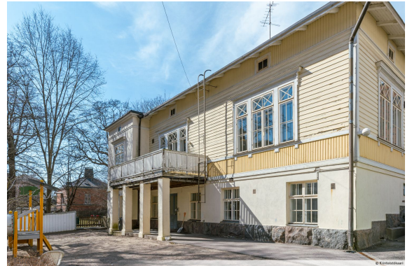
Kuva: Milla Teppo, Helsingin katu | Kiinteistökaari