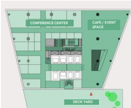
Länsitorni 3. krs