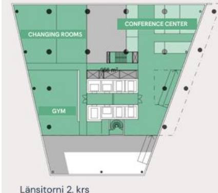
Länsitorni 2. krs