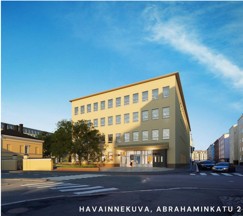
HAVAINNEKUVA, ABRAHAMINKATU 2