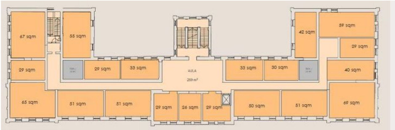
Hotelli 2 & 3. krs