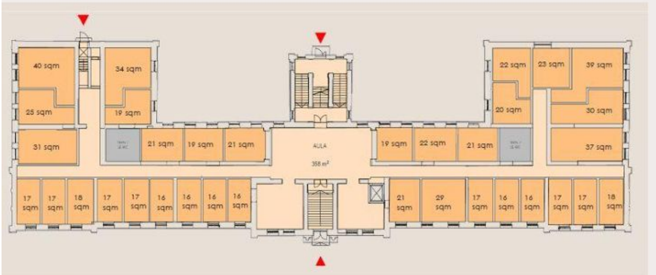
Hotelli 1. krs