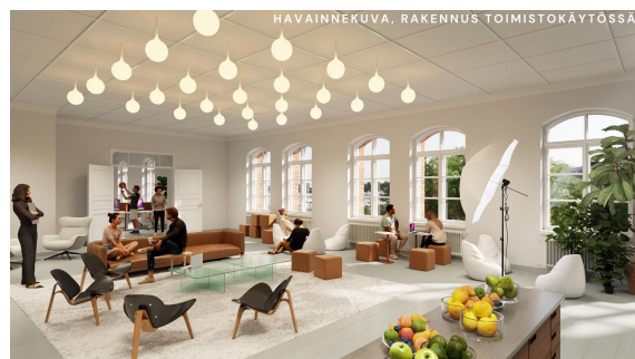
HAVAINNEKUVA, RAKENNUS TOIMISTOKÄYTÖSSÄ