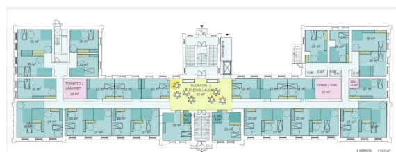
Palvelutalo 1. krs