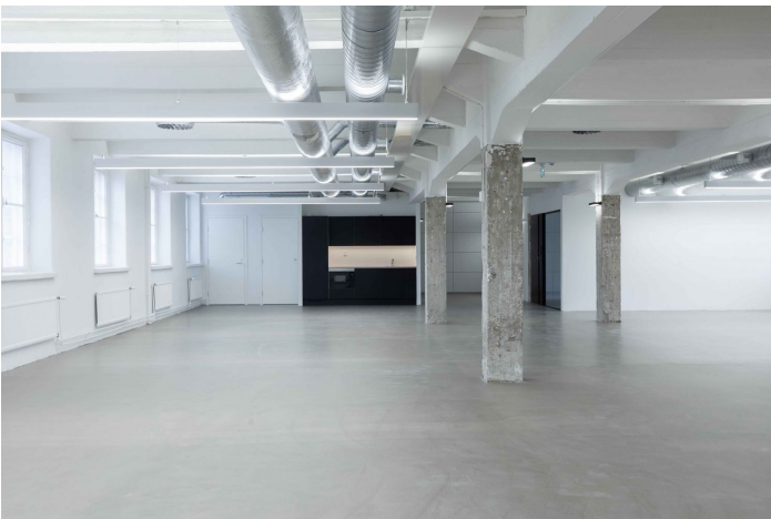
1. kerros / katutaso