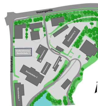
Savelankatu 3, Jyväskylä