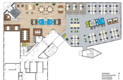
PACIUKSENKATU 27, 1.KRS, 523m 2