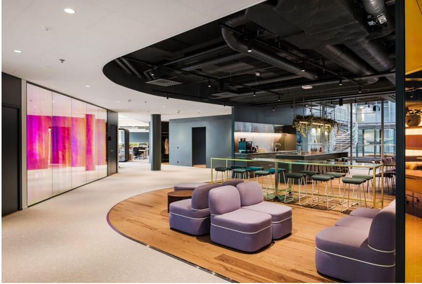
ARC, 5th floor (1157 + 1170 m 2 ) Keilalahdentie 2-4, 02150 Espoo IDEAL FOR 160-200 PEOPLE