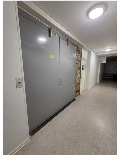
Viinikankatu 45 – 30 m 2 2. kerros