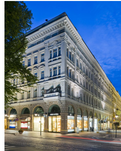
Pohjoisesplanadi 35 – Mikonkatu 2 6.krs | 220m 2