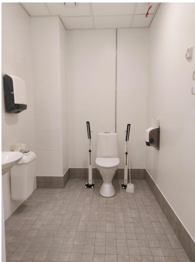
LIIKETILA 182 m 2