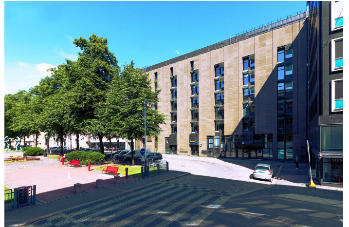
Kiinteistö Oy Paasivuorenkatu 3 Paasivuorenkatu 3 00530 Helsinki