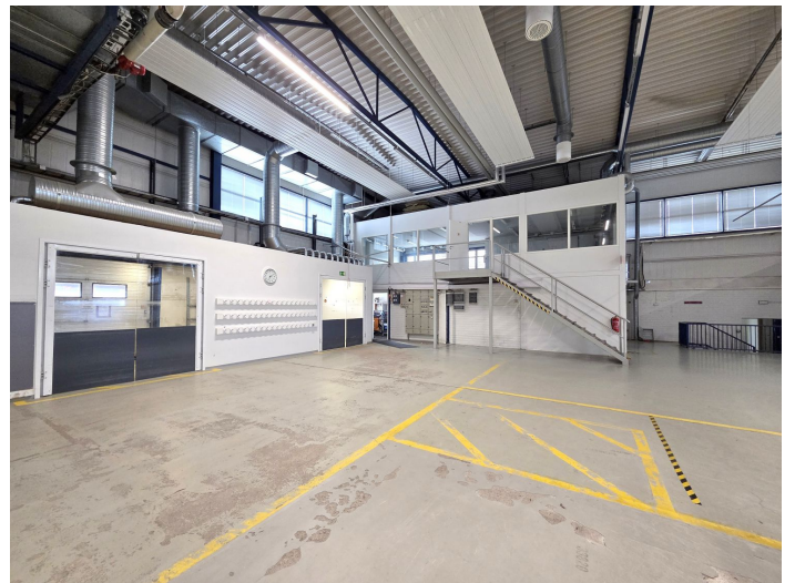
Kenkätie 7 - Pirkkala