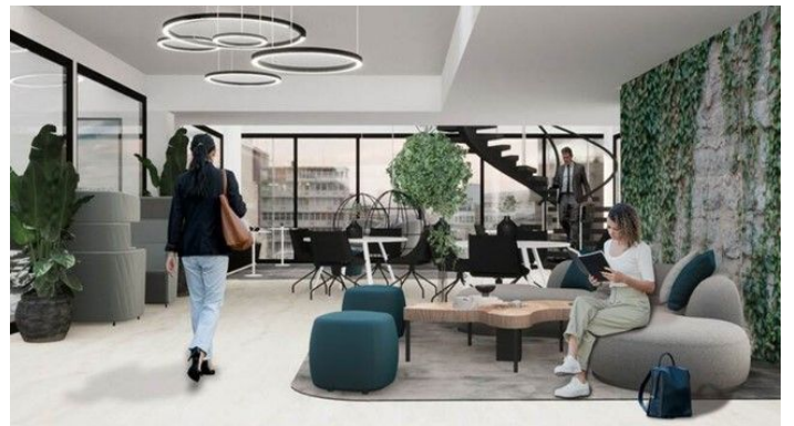
MaarinPortti 6. kerros, lasitettu- ja kattoterassi (suuntaa antava)