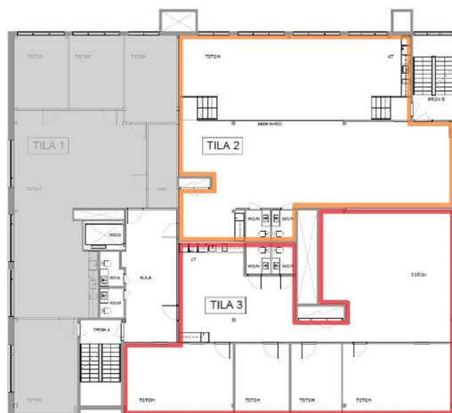
Höyläämötie 14 - 3. krs