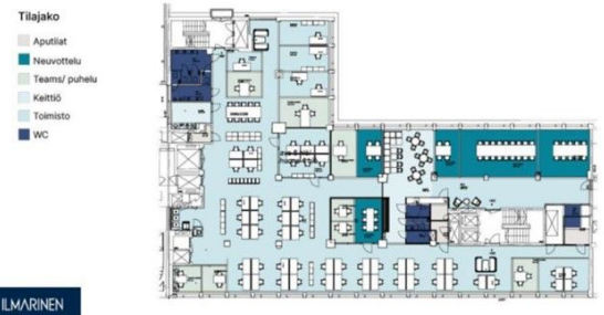
Toimisto 794,5 m 2

Alvar Aallon suunnittelema ja vuonna 1964 valmistunut rakennus sijaitsee osoitteessa Fabianin katu 29. Vilkaan Aleksanterinkadun ja tunnelmallisen Esplanadin puiston välissä sijaitsevalla kiinteistöllä on tärkeä kaupunkikuvallinen asema ja kulttuurihistoriallista merkitystä suunnittelijansa vuoksi. Julkisivuratkaisultaan Alvar Aallolle tyypillisessä kiinteistössä yksityiskohdat ovat ainutlaatuisia ja hyvin suunniteltuja. Rakentamisessa on käytetty laadukkaita materiaaleja - rakennuksessa on jäljellä alkuperäisiä kiinteitä sisustuksia. Suurempaan tilantarpeeseen Fabianinkadun edustavat ja viihtyisät tilat ovat tarvittaessa yhdistettävissä Aleksanterinkatu 30-34:ään. Kluuvin parkkihalli sijaitsee aivan kiinteistön vieressä, ja raitiovaunu-, bussi- ja metropysäkit ovat muutaman askeleen päässä.