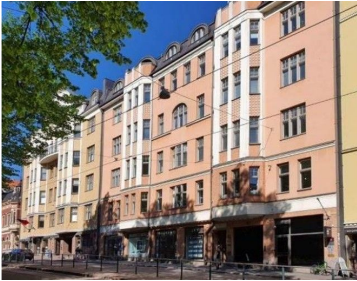
Helsinki Kaartinkaupunki Erottajankatu 9 B, 7. krs 44 m 2