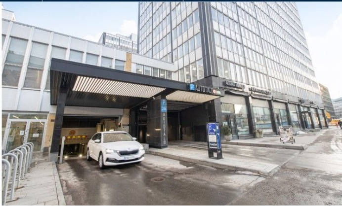
Fredrikinkatu 48 > Varasto- tai tuotantotila 236.5 m 2 > Fredrikinkatu 48,