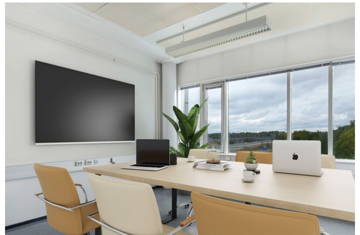
TAMPERE POSTITORVENKATU 16 3. krs iso 537 m 2 1:150 (A4) 18.2.2013