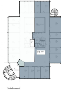
TAMPERE POSTITORVENKATU 16 3.KERROS 1:150 (A3) 19.1.2026