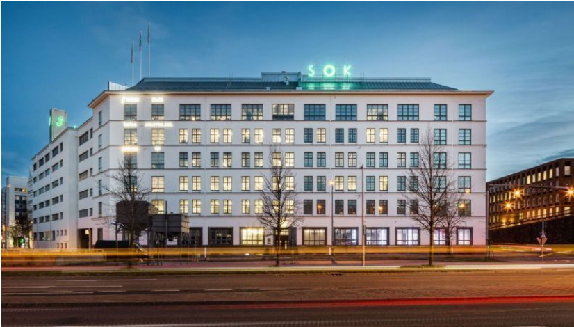
Colony Vallila, 4.Kerros 4D1 (460 m 2 )

Satamaradankatu 1, 00510 Helsinki IHANTELLINEN 25-35 HENGELLE