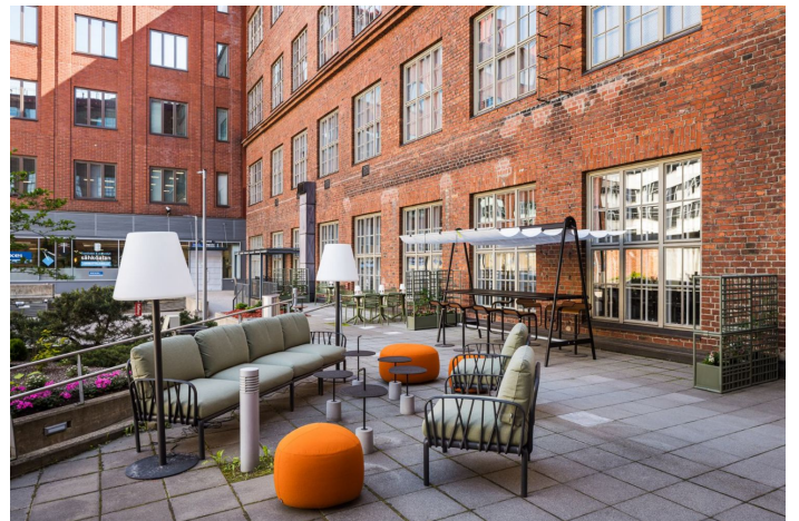
LINDSTRÖM TALO 00580 HELSINKI 5 KRS SUUNNITTELIJA 1200/2016