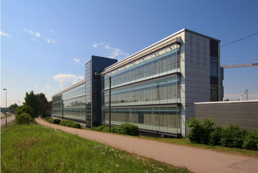
NIITYTAIVAL 13, 3KRS, 374m 2

Työpöytä pöytäseura 27 Tällorunko 2 Terveystieteiden 4 Kokoushuoneita 4 Käytävien ja oviaukkojen 1