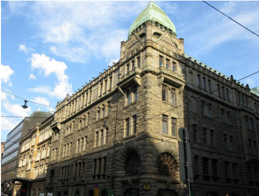
ALEKSANTERINKATU 44, 7.KRS Toimisto 137m 2