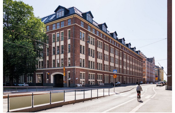
Merikortteli Tila 213 569 m 2 2.krs