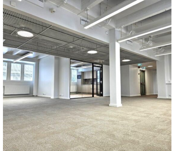
Pohjoisesplanadi 35 - Mikonkatu 2 6.krs | 220m 2