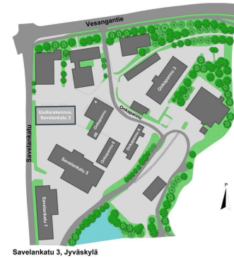
Savelankatu 3, Jyväskylä