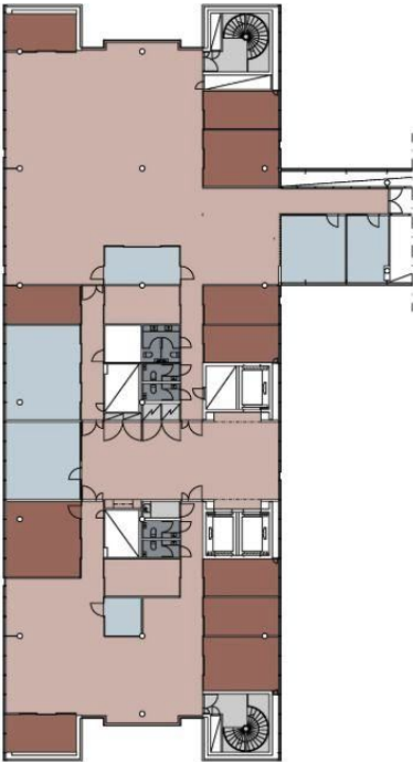
Pohjapiirros on esimerkkiratkaisu, tilat muokataan asiakkaan tarpeen mukaan.