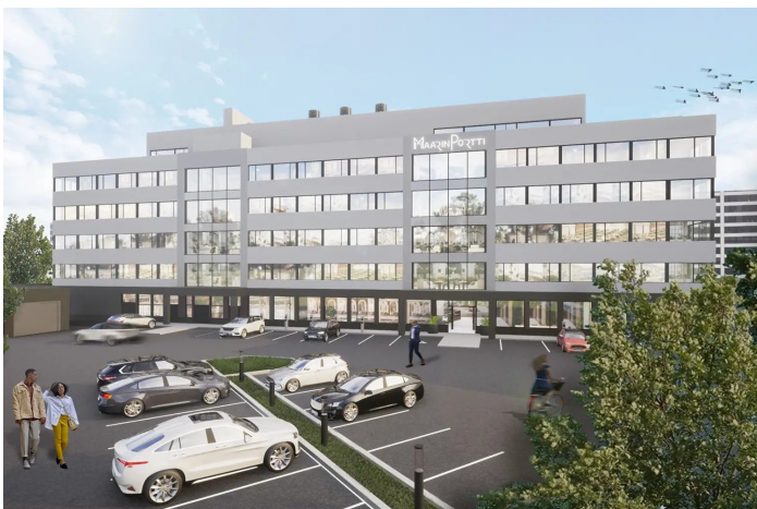
MaarinPortti Kerrokset 2-5 (suuntaa antava)