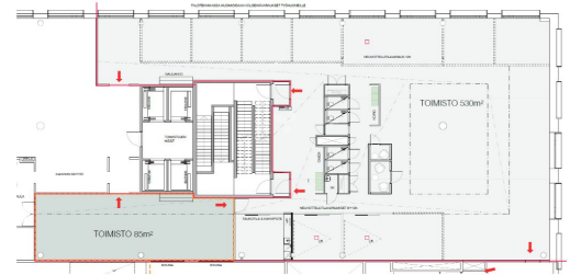
WORKERY WEST Toimisto 530 neliötä

Toimistosta avautuvat hienot maisemat, ja sijainti tarjoaa erinomaiset kulkuyhteydet niin julkisilla liikennevälineillä kuin omalla autolla. Kiinteistössä on runsaasti pysäköintitilaa sekä sujuvat mahdollisuudet vieraspysäköintiin. Työmatkapyöräilijöitä ilahduttavat