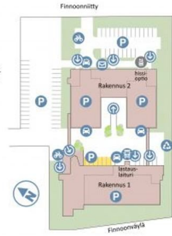
Esimerkki tilaohjelmasta 2: