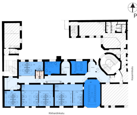
1:200 A4 Kalustus on viitteellinen.