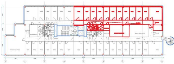
08.05.2009 KIIRULANKULMA OY SINIKALLIONTIE 12 ESPOO 1:200