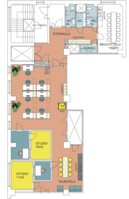
SÖRNÄISTEN RANTATIE 27 B 6.KERROS