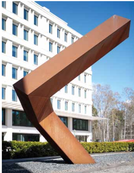
Julkisivun aukkofasadi on tunnistettavaa tapiolalaista tyyliä.