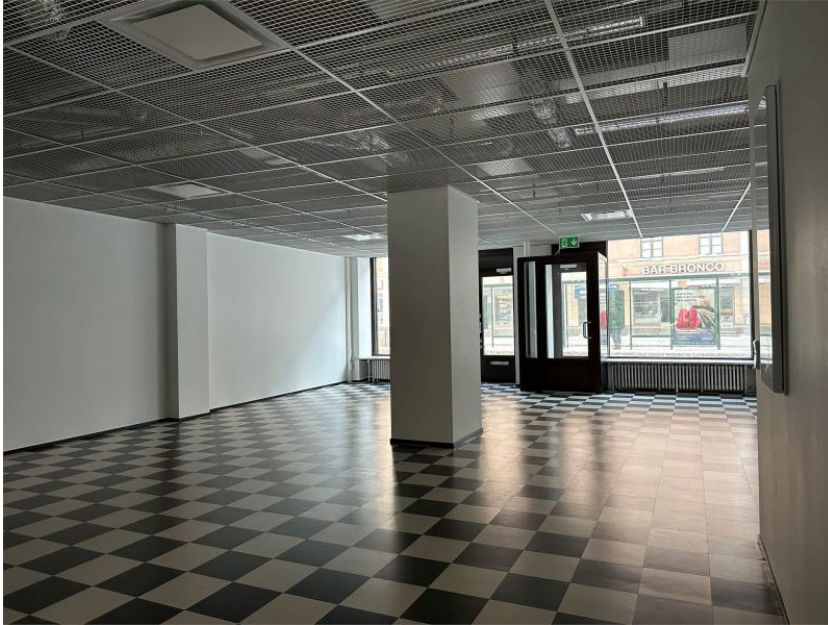
Hämeentie 48, 00500 Helsinki LIIKETILA 3 189,0 m 2